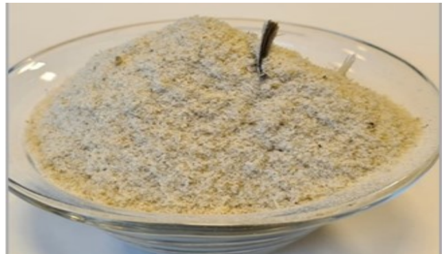
Bildet viser pulver etter saging av tørrfisk.

bearbeiding inn før det er helt klart. Siden utvanning gjøres på ulike måter i ulike bedrifter, har det ikke vært mulig å beregne mengde pulver. Tilgjengelig volum av dette råstoffet er derfor ukjent.