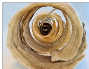
Bildet viser fiskeskinn fra tørrfisk. Produktet er interessant som råstoff til ekstraksjon av kollagen.

Torskeskinn er et etterspurt råstoff for ekstraksjon av marint kollagen. Ved produksjon av enkelte lutede og utvannede tørrfiskprodukter, tas skinnen av. Dette er semitørt og et relevant råstoff for produksjon av marint kollagen.