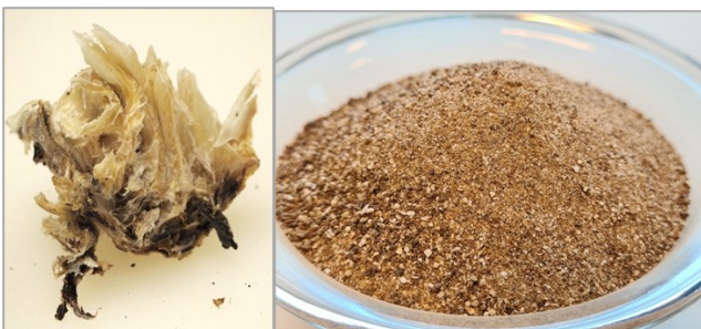
Bildet viser nakkebein og oppmalt nakkebein.

Nakkebein finnes hos de fleste store aktørene innen tørrfisk. Næringen anslår et tilgjengelig volum på 50 tonn. I UTHENGT prosjektet ble nakkebeina kvernet, tørket og møllet. Resultatet var et fint pulver som er interessant som smakstilsetning. I tillegg vil det oppmalte pulveret være aktuelt både i pet-food og gjødsel. Alle disse markedene kan bidra til økt verdiskaping av nakkebein.