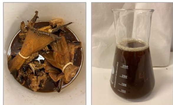
Bildet viser utvannet tørrfisk som råstoff for fiskesaus.

I motsetning til tørt restråstoff, har en del av det våte restråstoffet kort holdbarhet. I prosjektet ble råstoffet benyttet til en prøveproduksjon av fiskesaus, med gode resultater.